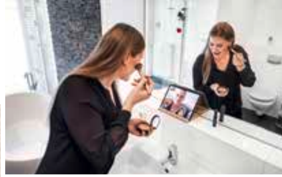
Dank Glasfaser ist die Video-Konferenz mit der Freundin kein Problem mehr.