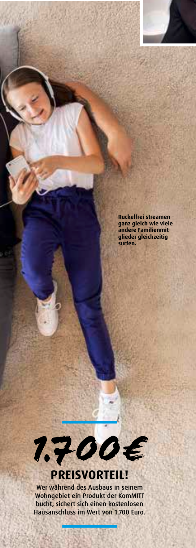
Ruckelfrei streamen – ganz gleich wie viele andere Familienmitglieder gleichzeitig surfen.